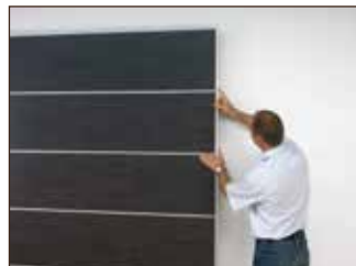
Anbringung der Abdeckleisten