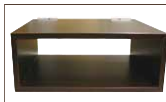
Receiverkasten z.B. für Receiver, DVD-Player etc. T 37,0 x B 49,0 x H 31,5 cm