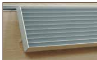
CD-Halter 200 mm

19 x 370 x 600 mm in den jeweiligen Dekoren der Multifunktionswand