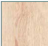
Eiche Orleans Dekornachbildung