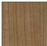
Kirschbaum Diamant* Dekornachbildung