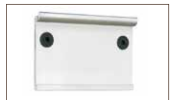
Universalhalterung Länge 95 mm inkl. 2 Bohrlöcher (Bohrung gem. der VESA-Norm)