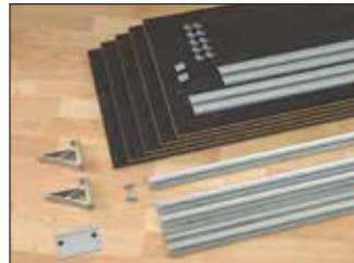
Set-Inhalt - mittlere Größe

Insbesondere durch die fußlose Aufhängungsmöglichkeit des Flachbildschirms wird die freischwebende Multifunktionswand zum echten Hingucker.