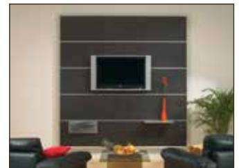
Beispieldarstellung (Zubehör nicht im Set enthalten)