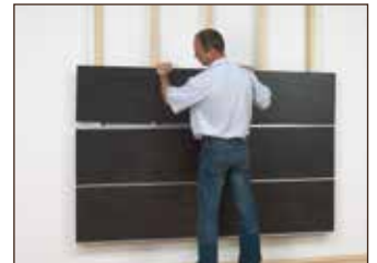
Anbringung der Paneele