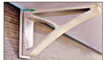
Bodenhalter zweiteilig; verstellbar und passend für Böden von 18-22 mm Stärke